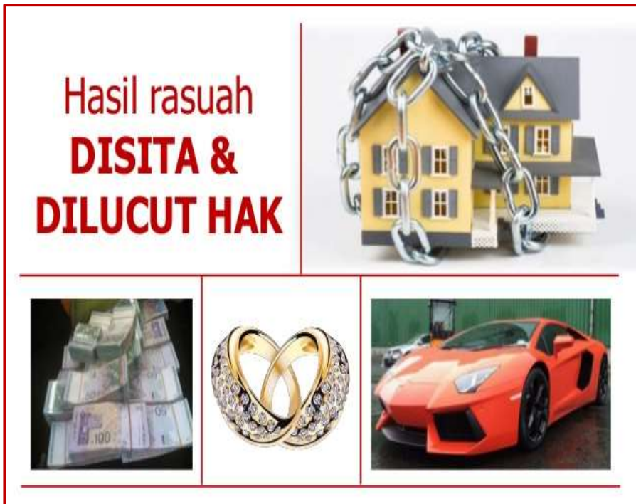
Gambar Hiasan: Antara bentuk-bentuk suapan rasuah yang sering diterima oleh perasuah dalam menjalankan tugas rasminya.

Marilah sama-sama kita berusaha mempertingkatkan integriti melalui kesedaran agama dan moral dalam memastikan amanah yang dipikul sebagai penjawat awam atau mana-mana jenis pekerjaan tidak digadai semata-mata kerana suapan rasuah.