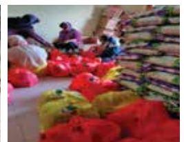
Penyerahan Bantuan COVID-19 di FELDA Wilayah Mempaga.